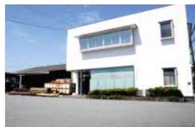
■本社・プレカット工場